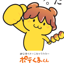
秩父市イメージキャラクター ポテつまん

市では、安定的に質の高い雇用を確保するため、市内企業の支援と企業誘致に積極的に取り組んでいます。旧秩父セメント第一工場跡地への誘致活動も継続的に行っています。また、中心市街地の活性化をはじめ、商業の振興にも力を入れています。こうした取り組みの一部をご紹介します。